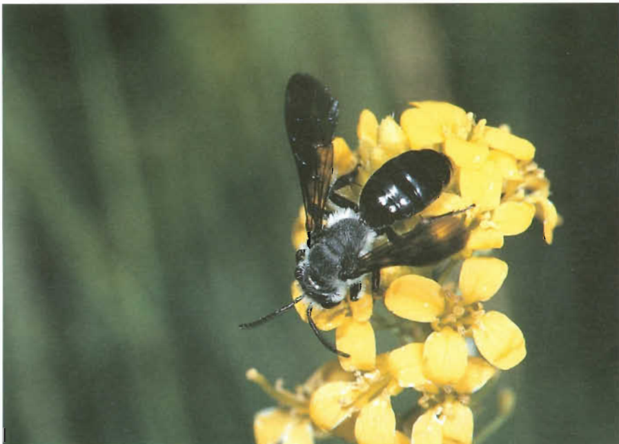
Abb. 2: Andrena afrensis WAR., Hochtenn, Juni 1996 (CH-Wallis) auf Barbarea .