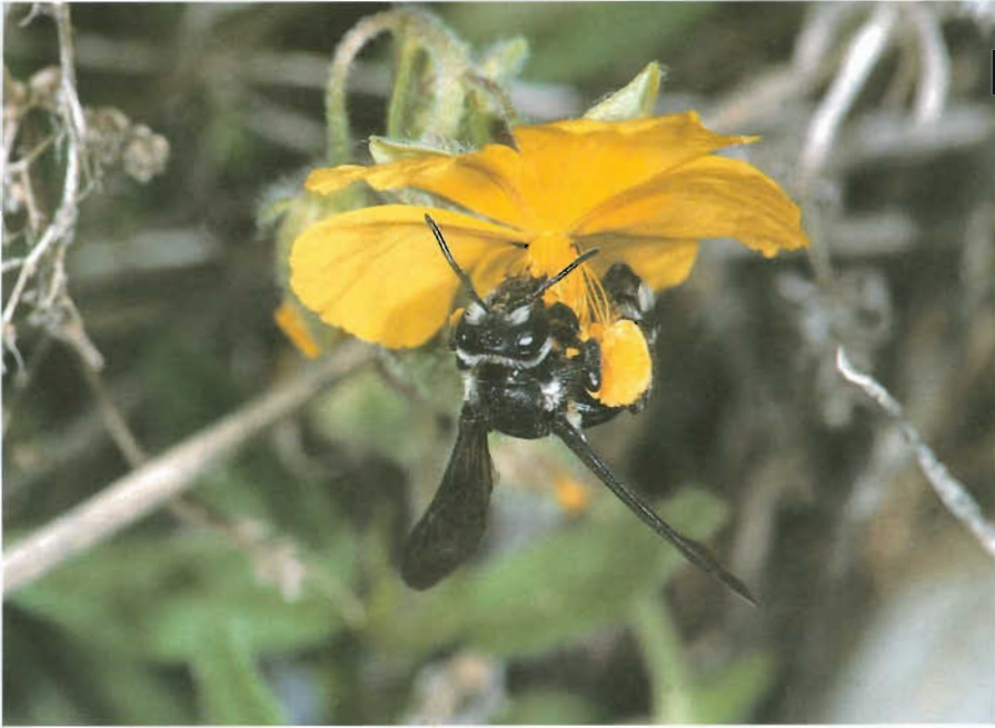
Abb. 1: Andrena afrensis WAR., Hochtenn, Juni 1996 (CH-Wallis) auf Helianthemum .